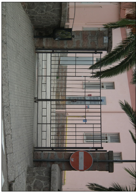
VECCHIO CANCELLO CARRABILE