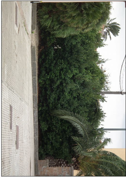
BANCHETTONE DA DEMORIE E RICOSTRUIRE